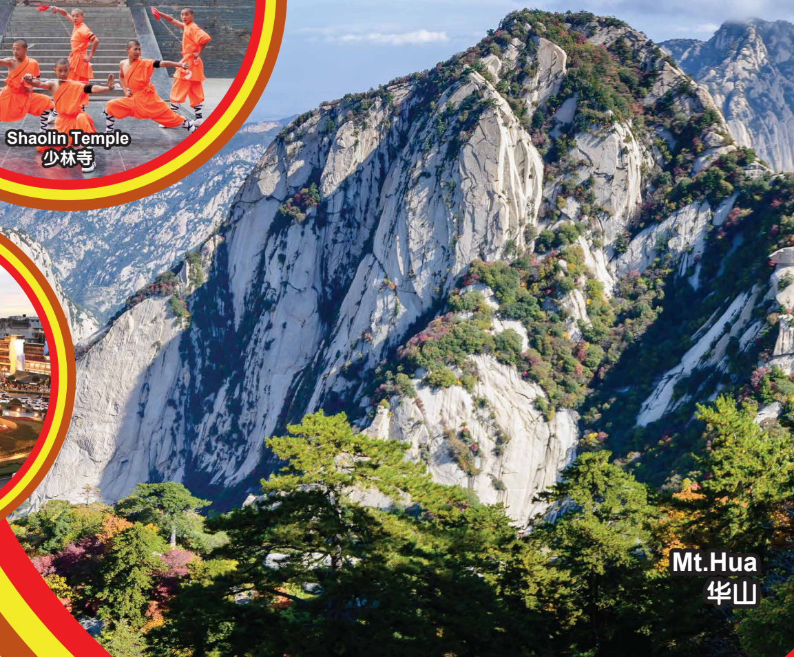
Mt. Hua 华山