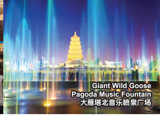
Giant Wild Goose Pagoda Music Fountain 大雁塔北音乐喷泉广场