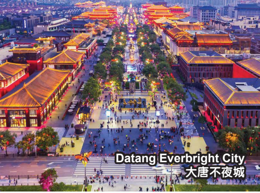
Datang Everbright City 大唐不夜城