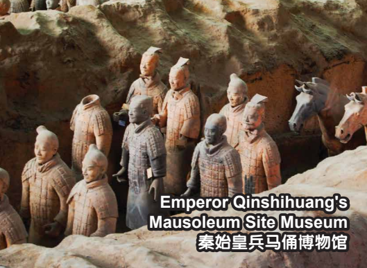
Emperor Qinshihuang's Mausoleum Site Museum 秦始皇兵马俑博物馆