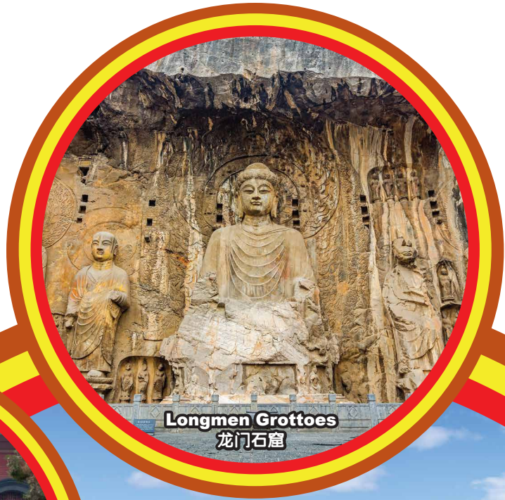
Longmen Grottoes 龙门石窟