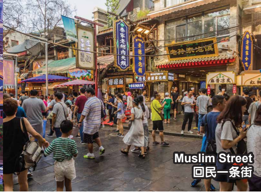
Muslim Street 回民一条街