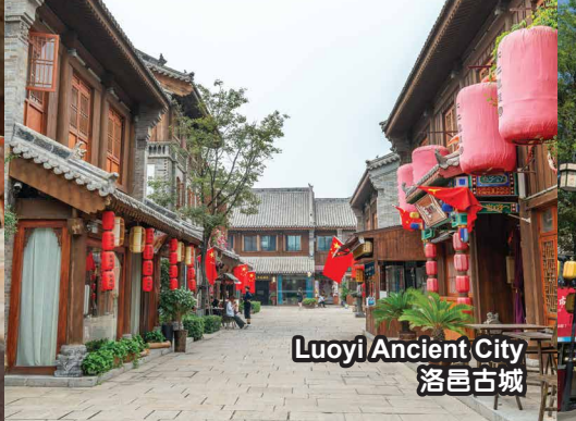
Luoyi Ancient City 洛邑古城