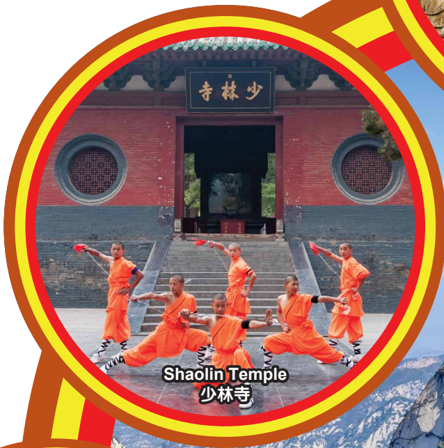
Shaolin Temple 少林寺