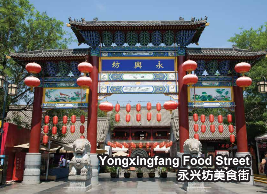
Yongxingfang Food Street 永兴坊美食街