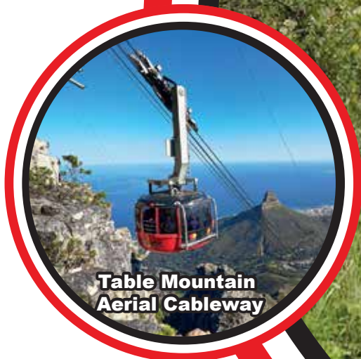
Table Mountain Aerial Cableway