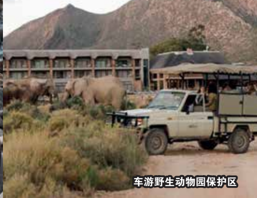
车游野生动物园保护区