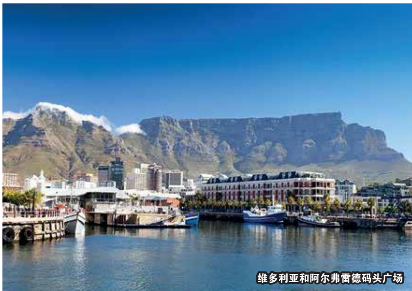
维多利亚和阿尔弗雷德码头广场