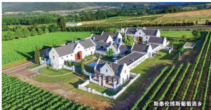
斯泰伦博斯葡萄酒乡