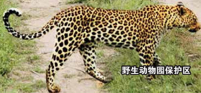
野生动物园保护区